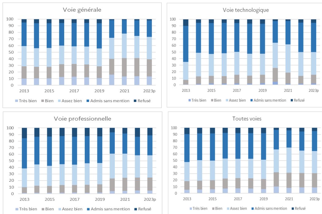
Figure 3 Résultats des candidats présents selon la voie depuis 2013 (en %)

Dans la voie professionnelle, le taux de mention progresse doucement jusqu'en 2019. Il augmente fortement en 2020 puis se stabilise jusqu'à la session 2023. Le taux de mention est de 58,5% (cf. figure 3).